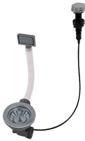
Piletta automatica Gun metal PG 8407 110