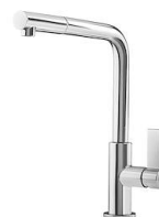
Miscelatore Omega Plus 8497 020