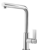
Miscelatore Omega 8497 000