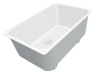
Vaschetta bianca 8153 100